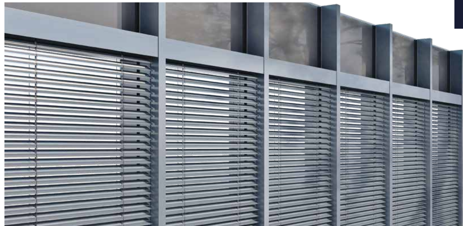
Jaluzele de fațadă și sistemul MB-SR50N ZS

Sistemul MB-SR50N ZS este o soluție inovatoare care combină sistemul jaluzelor de fațadă SkyFlow cu sistemul de fațadă cu montare pe stâlp și traversă a companiei Aluprof – MB-SR50N. Acesta a fost creat în primul rând pentru implementarea pe facilitățile/clădirile unde armonia deplină dintre aspectele tehnice și estetice joacă un rol special. Având în vedere aceste aspecte, au fost proiectate benzi speciale de presare care permit instalarea benzilor de umplere și mascare a fațadelor, care acționează și ca un ghidaj pentru jaluzele de fațadă. Datorită acestui fapt, decizia de a instala acest tip de acoperire poate fi luată într-o etapă ulterioară a investiției, când fațada este deja instalată pe clădire. Întregul mecanism al jaluzelor este, de asemenea, discret ascuns în spatele unei casete din aluminiu extrudat. Produsul este disponibil cu ghidaj din aluminiu și ghidaj pentru cabluri. Dimensiunile maxime: 4500 × 4000 mm (supr. max. 18 m 2 ).